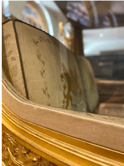
Details De Gouden Koets