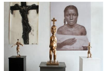
'Deep in me a passionate dream', Nelson Carrilho, 2017.

De tentoonstelling De Gouden Koets is in de eerste plaats een historische tentoonstelling. Door het parcours zijn ook 16 hedendaagse kunstwerken verweven. Daarnaast is de Amsterdam Galerij voor deze gelegenheid geheel heringericht met veelal nieuw werk over de Gouden Koets. Het Amsterdam Museum heeft zestien kunstenaars opdracht gegeven werk te maken dat aansluit bij de thematiek van de Gouden Koets. Onder andere Erwin Olaf, Brian Elstak, Berend Strik, Sharelly Emanuelson en nieuwe, aanstormende talenten als Airich en Serana Angelista leveren vanuit hun eigen ervaring, kennis en ambacht een artistiek commentaar op de materialiteit en de iconografie van de koets.