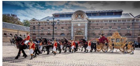
De Gouden Koets.

De Gouden Koets wordt getoond in een glazen behuizing op de grote binnenplaats van het Amsterdam Museum. Bezoekers kunnen de gerestaureerde koets in alle rust van heel dichtbij bekijken. In zes museumzalen rondom de binnenplaats, alle met zicht op de Gouden Koets, worden uiteenlopende verhalen uitgelicht. Honderden cultuurhistorische objecten, schilderijen, Oranjesnuisterijen, kledingstukken, spotprenten, foto's en bewegende beelden geven een veelzijdig beeld van de geschiedenis en het gebruik van de Gouden Koets en de discussies uit verleden en heden over dit iconische voertuig.