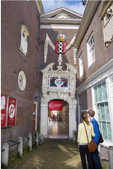
Amsterdam Museum, Richard de Bruijn